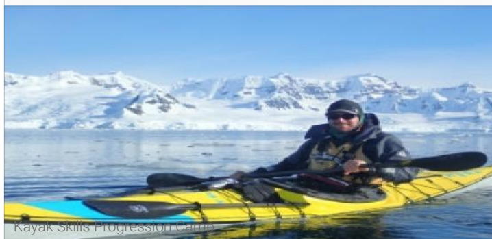
Kayak Skills Progression Camp