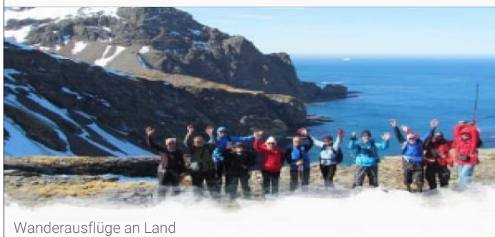
Wanderausflüge an Land