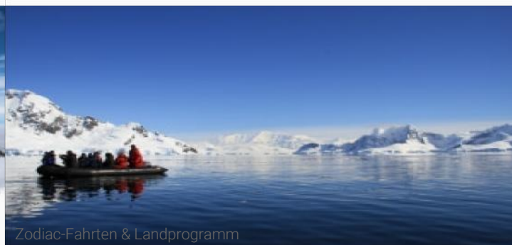
Zodiac-Fahrten & Landprogramm